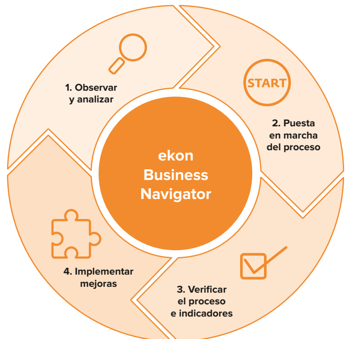
ekon Business Navigator – El proceso Lean Management, en cuatro fases.